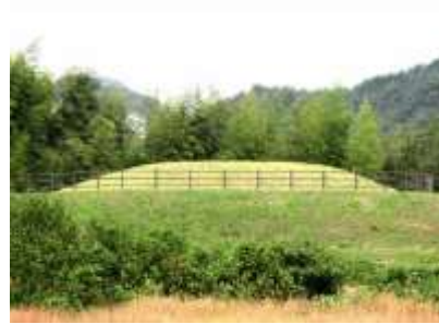
⑨砂行(すぎょう)1号古墳

赤谷池・烏帽子岩については下有知風土記5で、砂行1号古墳は下有知風土記19で詳しく紹介しています。