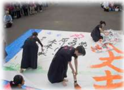
関有知高校の書道部の皆さん