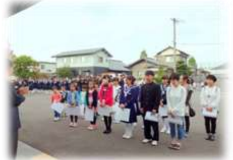
挨拶標語の表彰式 おめでとう