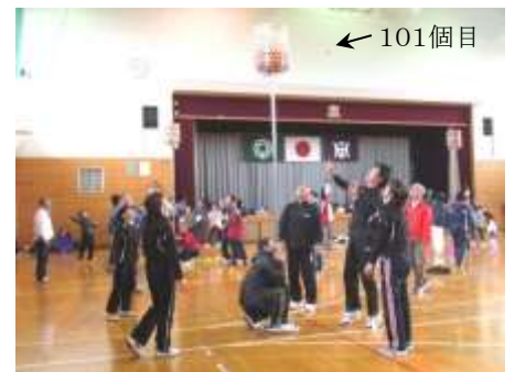
最後の101個目が入ります