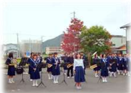
下有知中学校吹奏楽部の演奏