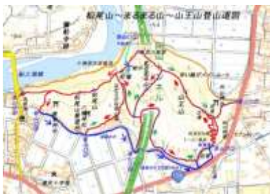
山王山～まるまる山～松尾山登山道図

山王山登山道の整備はまだ始めたばかりで、今後は、駐車場の整備・山王山山頂の展望の確保・山王山山頂～長良川展望地～堀切～岩場～まるまる山までの登山道の整備・案内板の設置などを多くの皆様のご協力を得て徐々に進めてゆきたいと思っております。詳細はしもうちホームページに掲載しています。