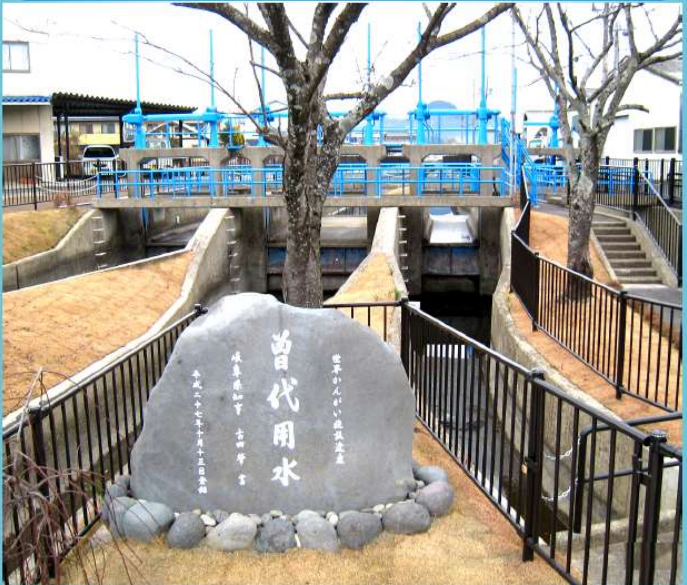
平成27年10月13日に世界かんがい施設遺産に登録された 曾代用水