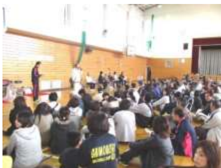
市長にも出席いただいた開会式

「たかが玉入れと、侮ることなかれ！」参加者の方のお言葉です。下は幼保園児から上は80歳を超える高齢者まで競技することができ、ルールも背の高いカゴに玉を入れるだけと、分かりやすいのですが意外と奥の深い競技の様です。でもこれは、経験した人にしかわからない事実のようです。皆さんも感じてみてはいかがでしょうか？