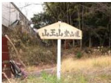
山王山しもうち登山口