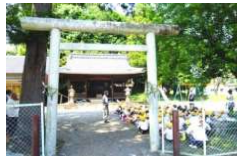
⑳曾代用水 杖之戸分水