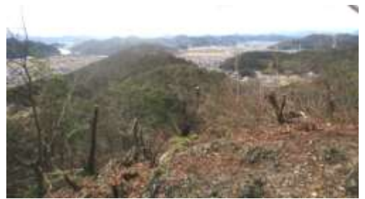
山王山山頂からの景色