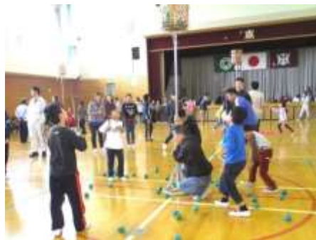
子供たちも楽しみました