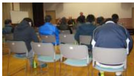
5・8・9・10区の語る会