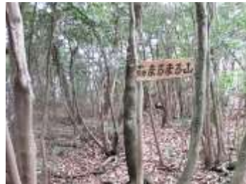
自然林を歩く登山道

山王山登山道の整備にご理解をいただける方が居られましたらご協力をお願いいたします。