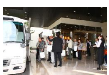
敬老会も終わり帰路の途に…