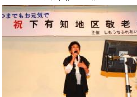
出席者によるカラオケ