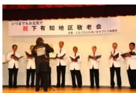
関男声合唱団のコーラス