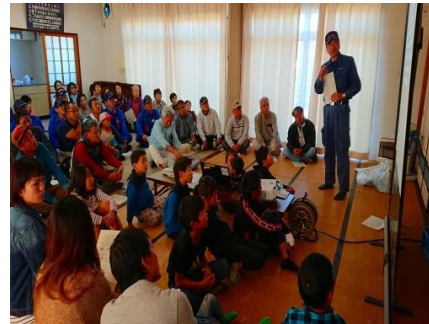
【ふれあいまちづくり協議会 安全・安心部会主管事業】