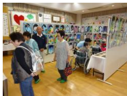
【ふれあいまちづくり協議会文化・交流部会主管事業】