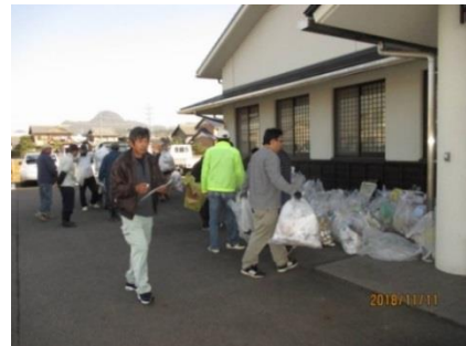
【ふれあいまちづくり協議会 生活・環境部会主管事業】