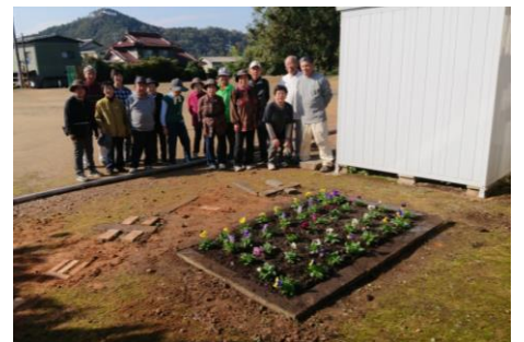
【ふれあいまちづくり協議会 生活・環境部会主管事業】

本年度から新たに、地域住民の生活、環境の向上を目的に、花壇等の整備事業を進めています。初年度の今回は3つの区会が取り組みを行い、上切公民センター、東志摩南宮神社、中央集会場、重竹公民センターの4カ所で花壇整備やプランターへの植栽が行われました。いずれも地域の子どもから高齢者まで多くの皆さんが集い交流する場の花植えです。集まった人たちのふれあいや、地域の絆が更に深まるきっかけになれば素晴らしいことと思えます。みんなで推進しましょう。