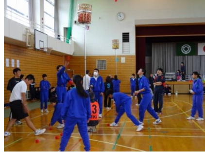
【ふれあいまちづくり協議会健康スポーツ部会主管事業】