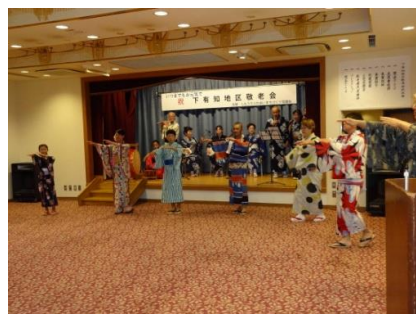
【ふれあいまちづくり協議会 福祉・子育て部会主管事業】